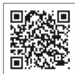
Vídeo Quicksilver Activ 755 Sundeck (Náutica Guixòls)

Las Activ 755 Open y Sundeck son dos versiones de un mismo barco. La Open es en realidad un modelo de consola central, despejado en la zona de proa, contrariamente a lo que ofrece la Sundeck, con una cubierta ocupada por un solárium que ocupa toda la proa. Existe otra pequeña diferencia sustancial en ambos barcos: la Open tiene el puesto de gobierno central, y la Sundeck lo ha desplaza-