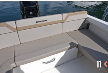
11 <> 12