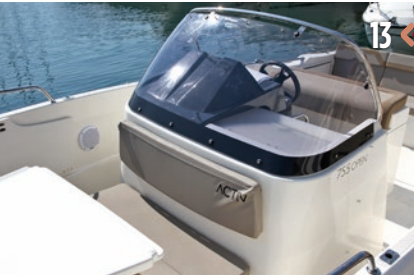
13 <> 14