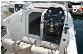
15 <> 16

>> Tanto la Open como la Sundeck brindan una notable polivalencia de uso, perfectamente adaptadas a los 250 Hp de Verado.