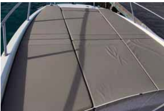
En la Sundeck toda la proa es un solárium acolchado.

estas características. Navegando en una zona protegida en condiciones entre mar rizada y de fondo, después de un fuerte temporal, la 675 Open resultó fácil de manejar, evolucionando bien entre unos 21 y 24 nudos de crucero y marcando una máxima de 34,4 nudos, con buena estabilidad.