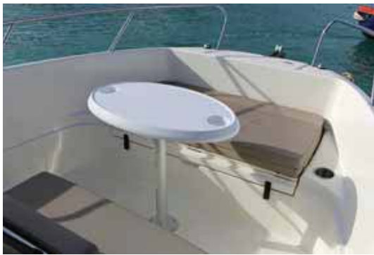
La mesa de popa se puede montar en proa en la versión Open.