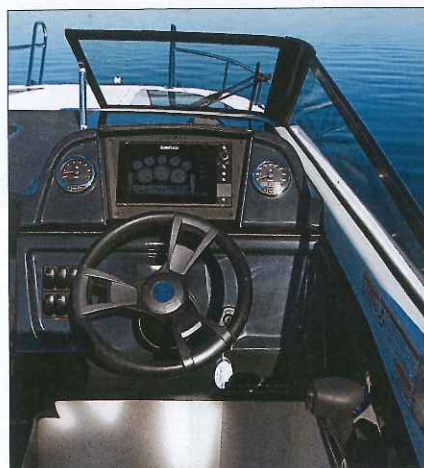
Le tableau est plutôt bien dessiné et moderne, mais il manque un vide-poche à portée de main.