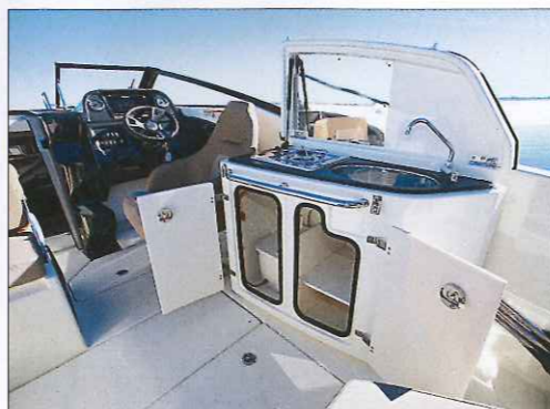
La cuisine extérieure optionnelle est très bien conçue avec un évier, un réchaud et de nombreux rangements.