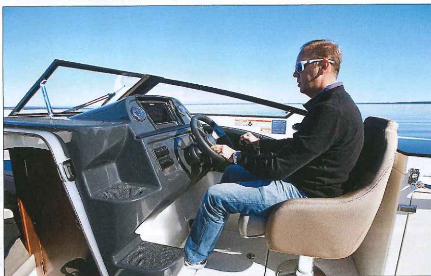
Assis, le pilote est idéalement installé, et les commandes tombent bien sous les mains. La position debout est moins confortable.