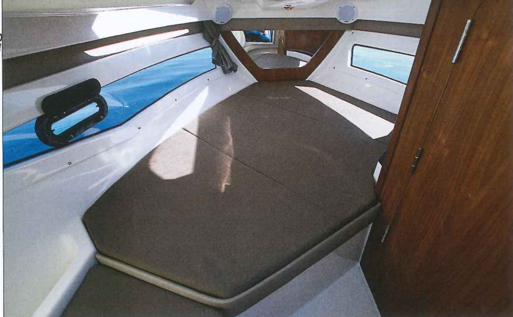
La superbe cabine très lumineuse est équipée d'un couchage double de belles dimensions (1,99 x 1,60 m) et placé de biais.

Ce nouveau Quicksilver 755 Cruiser fait le plein de qualités avec sa finition d'un excellent niveau, sa ligne moderne, ses aménagements très bien pensés et confortables et son tarif particulièrement concurrentiel.