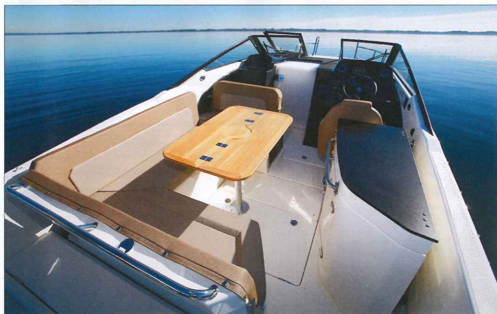
L'immense banquette arrière en L offre de nombreuses et confortables places assises autour de la table.

La table de cockpit en teck repliable facilite la circulation à bord. Elle est proposée en option au prix de 740 €.