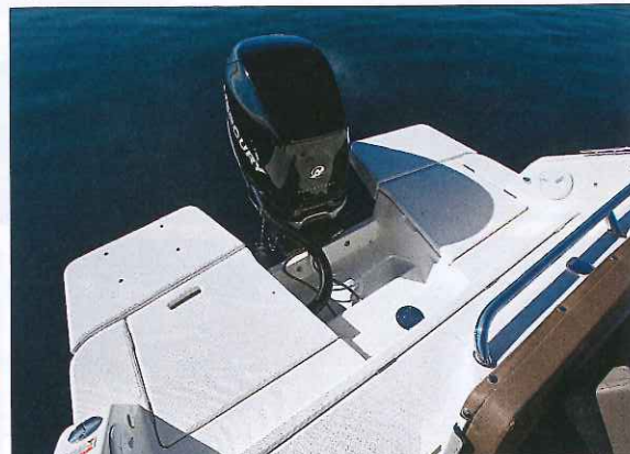
Grâce aux deux grandes rallonges proposées en option (600 €), les plages de bain sont immenses.