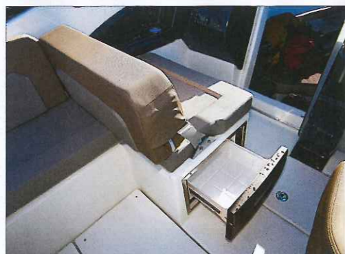
Le réfrigérateur de type tiroir se place sous la banquette de copilote et est inclus dans le pack Cockpit Confort.