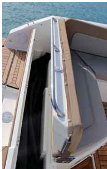
Incluye un ingenioso cofre transversal para estibar el bimini.

Junto al puesto de gobierno incluye una escalera estrecha.