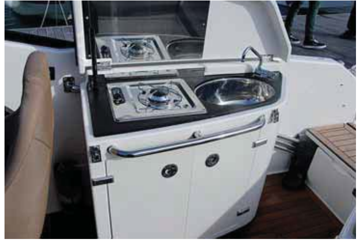
El mueble de cocina es una opción muy recomendable.

tras en la banda contraria el piloto se enfrenta a una consola de gobierno de compacto diseño aunque con espacio para pantalla central. Tras su asiento puede quedar un espacio libre o instalar un mueble opcional con una cocina exterior dotada de buen equipamiento. En la banda de babor se forma una gran dinette mediante un interesante asiento en forma de U, que cuenta con un respaldo reversible en proa y uno de mayor tamaño y abatible en popa, con los que formar diversas configuraciones. De hecho, gracias al acompañamiento de una mesa de ala plegable y base desmontable, es posible crear en esta zona un comedor o un amplio solárium abierto hacia popa.