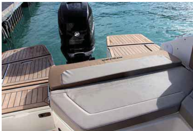
La popa se abre completamente abatiendo el respaldo posterior.

Con una eslora sobre los 7 metros, se trata de una lancha de buenas prestaciones con un buen volumen, que adopta una proa de profunda V sobre cuya cubierta, protegida por unos bajos candeleros, ofrece una buena superficie totalmente acolchable para tomar el sol, además de un cofre de fondeo con molinete interior. El parabrisas de gran inclinación ofrece una sección central practicable para acceder a una estrecha escalera integrada con la que bajar a la amplia bañera en la que discurrirá la mayor parte de la vida a bordo. En la parte delantera se sitúa el asiento del copiloto, de respaldo reversible, frente a una guantera alta, mien-