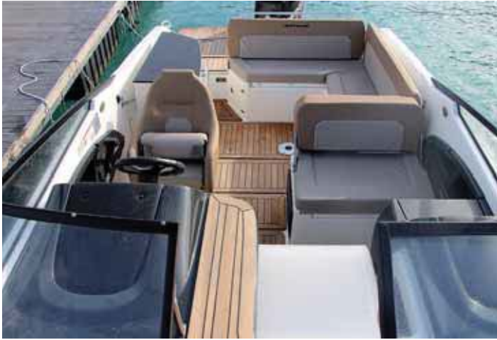
Se consigue una bañera bien aprovechada y protegida.