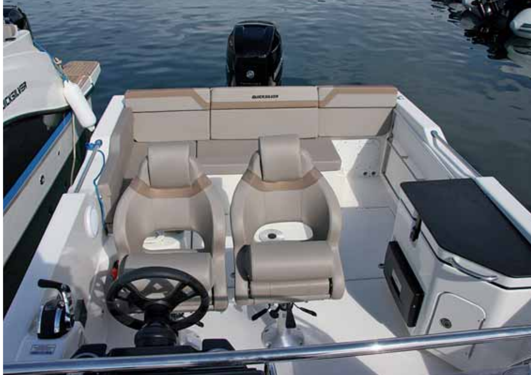
Disfruta de un buen francobordo interior en la aprovechada bañera.