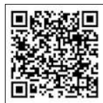
Video Quicksilver 805 Pilothouse (Quicksilver)

En efecto, en la mayoría de sus embarcaciones Quicksilver propo-