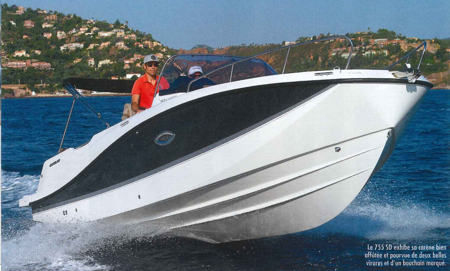
Le 755 SD exhibe sa carène bien affûtée et pourvue de deux belles virures et d'un bouchain marqué.

robuste banquette escamotable, sur bâbord, permet de créer un salon en C à l'arrière.