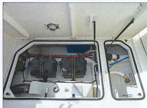
Le six cylindres Verado a besoin de deux batteries pour fonctionner, surtout en raison de la direction assistée.