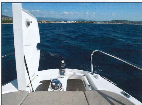
Le guindeau électrique disparaît complètement sous le capot de la baille à mouillage.

L'Activ 755 SD s'inscrit dans la lignée des efforts de Quicksilver pour monter en qualité, et le résultat est là avec une belle finition, un plan de pont plutôt bien pensé et un comportement marin très satisfaisant pour un programme familial.