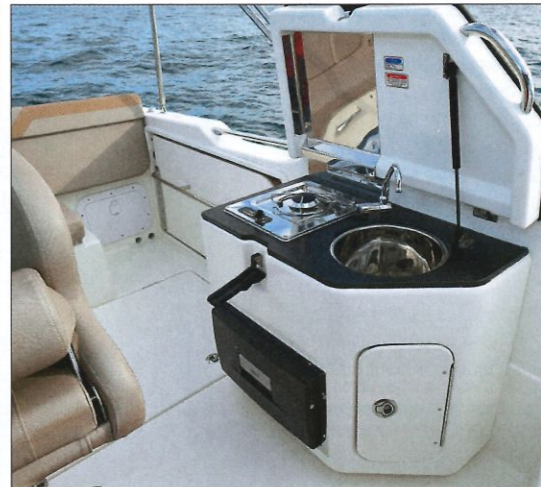
Le bloc-cuisine optionnel, comprenant un évier, un réchaud, un réfrigérateur et un rangement, est placé sur le côté bâbord.