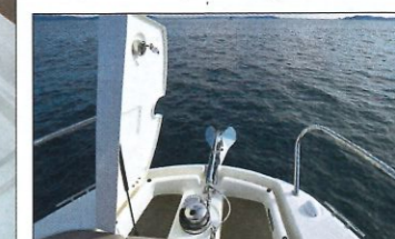
Le guindeau électrique est une option facturée 1 700 €.