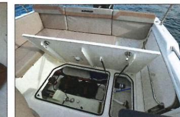
La soute technique dans le plancher offre un espace de rangement supplémentaire.