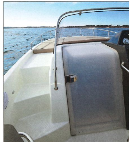
L'unique passavant latéral de bâbord est large (0,42 m) et propose donc un accès facile au solarium.