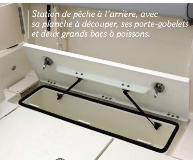
Station de pêche à l'arrière, avec sa planche à découper, ses porte-gobelets et deux grands bacs à poissons.

de conserver au mieux les appâts, ainsi qu'un tuyau de rinçage. Indispensables pour les pêcheurs, les porte-cannes ne manquent pas à bord sur les différents emplacements stratégiques, et le râtelier sur le hard-top de la cabine (en option) est très apprécié pour y ranger ses cannes. Même si elle peut être sportive, une partie