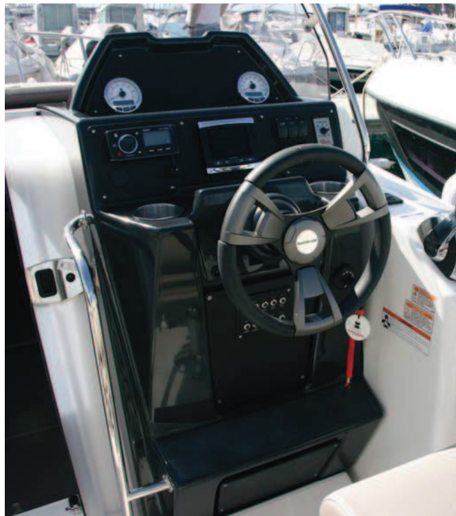
Se ha creado el puesto de gobierno sobre un estrecho y compacto molde.