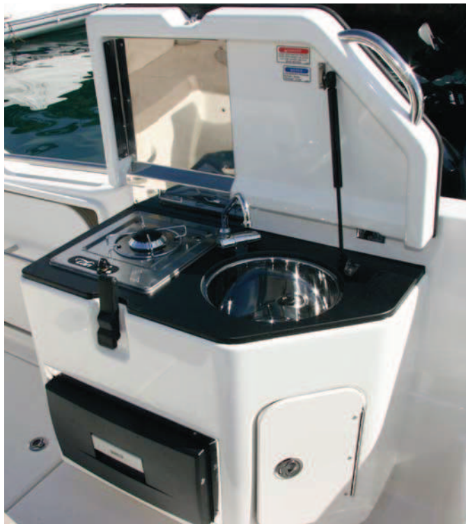
El mueble de la cocina es completo y con una gran tapa de voluminoso cierre.