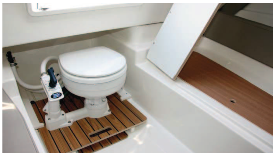
La cabina incluye un inodoro montado sobre carriles.