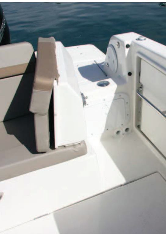
Con el asiento lateral plegable, se facilita la entrada por la puerta posterior.