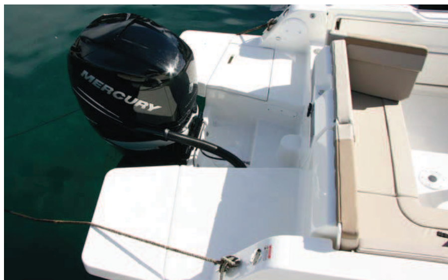
Se añaden dos suplementos para ampliar las plataformas de baño.