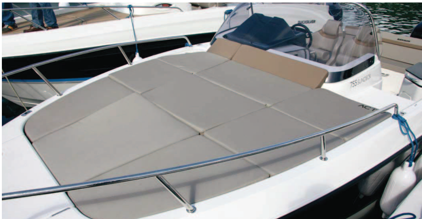
Ofrece un amplio solárium acolchado en la cubierta de proa.

Un sistema habitual de trabajo por parte de los astilleros en esloras medias y bajas es la presentación de una misma base con diferentes diseños de cubierta, con el fin de adaptarlas mejor a diversas actividades.