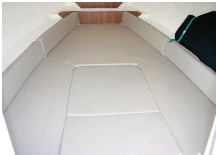
En popa ofrece una cama doble con el centro desmontable.