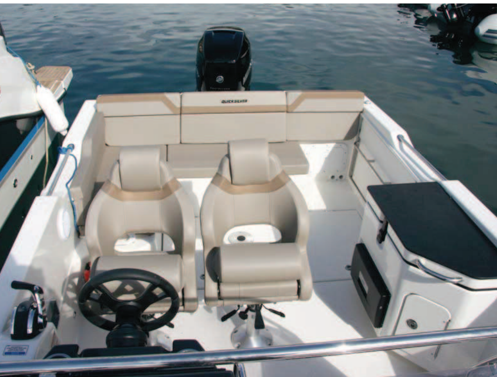
Disfruta de un buen francobordo interior en la aprovechada bañera.

bor y un cofre de estiba en el pasillo de entrada formado en la misma banda.