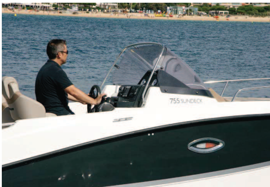
El parabrisas es profundo, inclinado y proporciona buena protección.